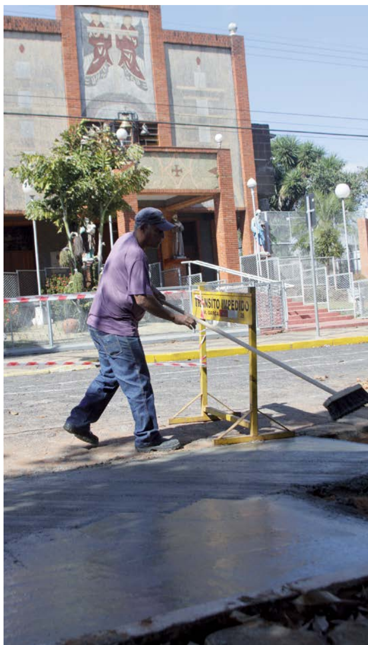
Pedido feito por vereador atendeu à solitação dos fiéis

A partir de agora, os fiéis que forem assistir às celebrações no Santuário Nossa Senhora de Lourdes, em Vila Araceli, sejam missas ou cerimônias de casamento, vão encontrar mais vagas para estacionar seus veículos. A Prefeitura Municipal, através da Secretaria de Obras e Departamento de Trânsito, finalizou nesta semana as obras do estacionamento 45 graus na Praça do Santuário, defronte à igreja. Página 4