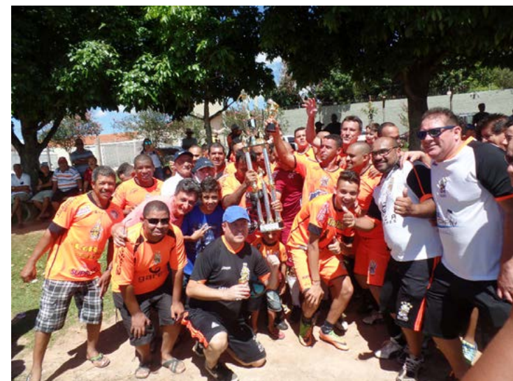
Com o tetracampeonato, Os Pior manteve a hegemonia no suíço garçense