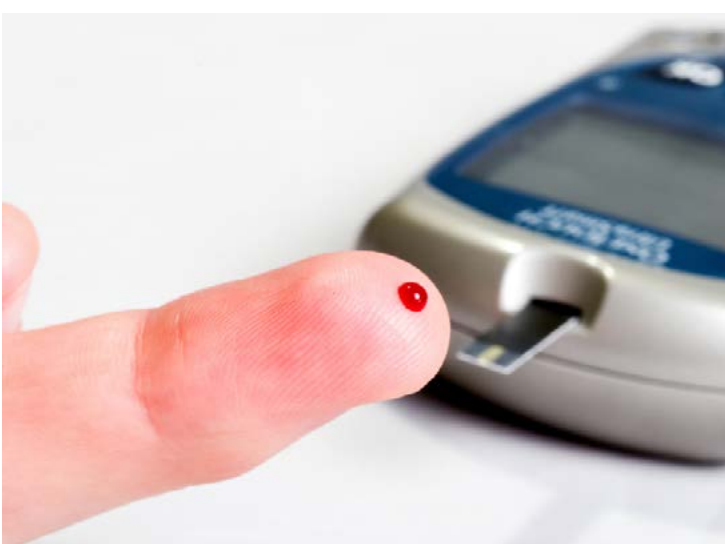
Testes podem ser feitos gratuitamente

Hoje, neste dia 14 de novembro, Dia Mundial do Diabetes, a Sociedade Brasileira de Diabetes e Sociedade Brasileira de Endocrinologia e Metabologia vão realizar ações gratuitas para cons-