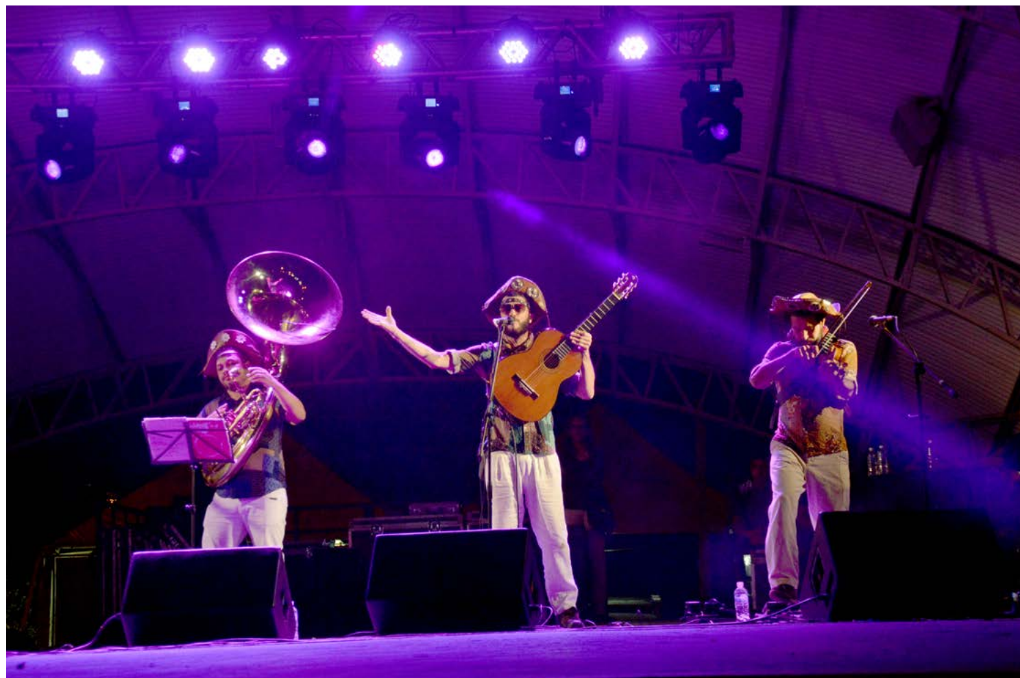
Banda Xaxado Novo impressionou o público, na noite de sábado